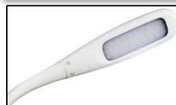
Particolare del diffusore